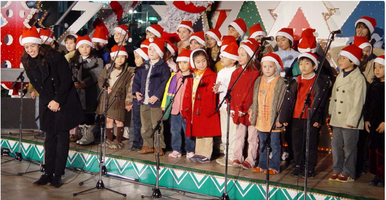
Drittes Weihnachtssingen der Deutschen Schule Kobe auf dem „Heidelberger Weihnachtsmarkt“ im Stadtteil Umeda (Osaka)

Nr. 2 • 1. Jahrgang • Japan News der Familie Schiller aus Kobe / Japan • 2004-12-05