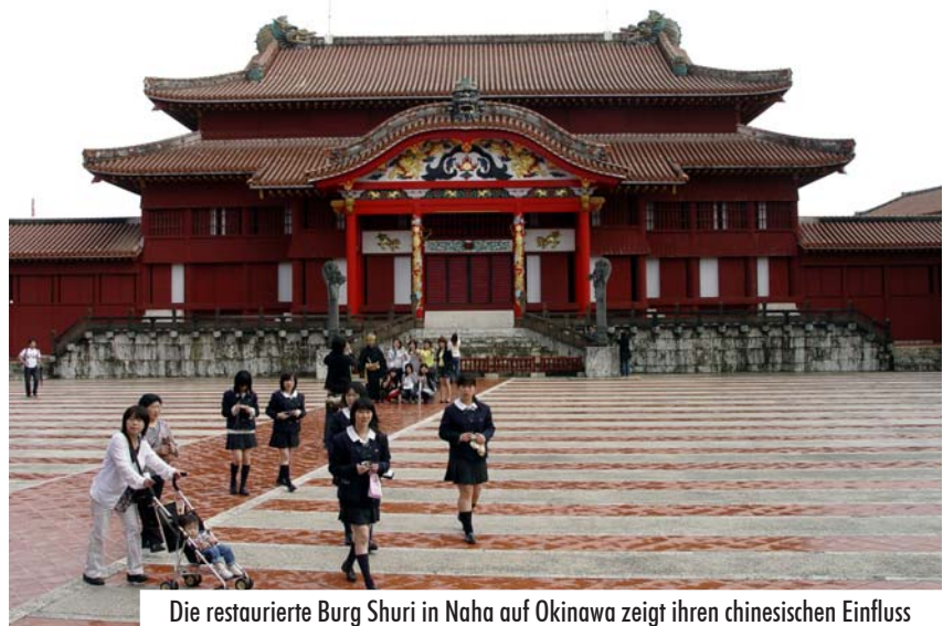
Die restaurierte Burg Shuri in Naha auf Okinawa zeigt ihren chinesischen Einfluss

Hier befindet sich ein Friedhof mit über 200.000 Gräbern, Statuen und Monumenten. In nordöstlicher Ausdehnung am äußersten Rand liegt das Mausoleum von Kobodaischi . Wir erfahren viel Wissens-