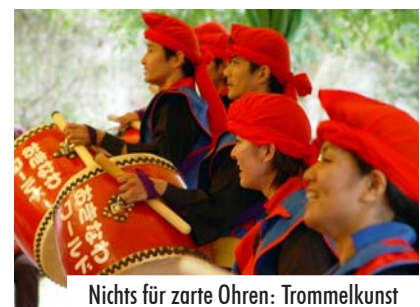
Nichts für zarte Ohren: Trommelkunst

Die viertägige Reise soll ein letztes Abenteuer bergen: Das Befah-