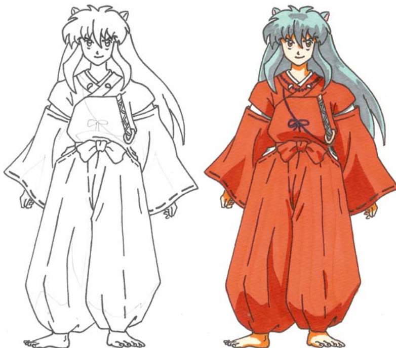
Mangazeichnen im Selbstversuch (vorher / nachher)