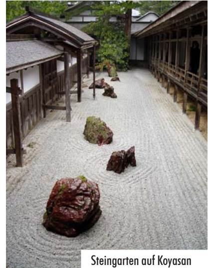
Steingarten auf Koyasan

Manchmal ist es ja von Vorteil, nicht immer alles, oder vielmehr fast gar nichts zu verstehen. Ein abendlicher Abstecher mit zwei Kollegen, davon einem deutsch sprechenden Japaner soll in eine Stehkneipe in Juso führen. In den engen Straßen gibt es ein vielfältiges Angebot, und so kommen wir in ein Lokal, dass zwei auf zwei