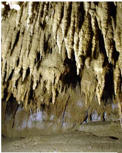
Sind das nun Stalaktiten oder Stalagmiten?

ren japanischer Straßen mit einem Mietwagen. Das Eröffnungs-Paket der Flugzeuggesellschaft beschert uns diese besondere Gelegenheit.