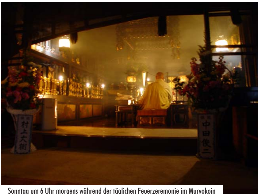
Sonntag um 6 Uhr morgens während der täglichen Feuerzeremonie im Muryokoin

Nachzureichen ist auch, dass in früheren Zeiten in derlei Kneipen das Tagesgeschäft fortgesetzt wurde. Was tagsüber nicht verhandelt werden konnte oder sollte, wurde hier getan. Dabei sollen sogar Na-